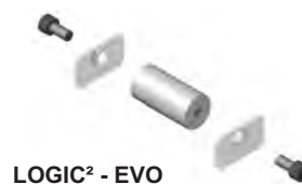
LOGIC 2 - EVO