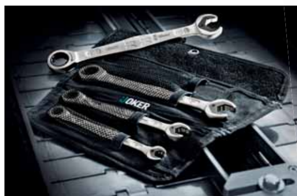
L'ensemble Joker, composé de quatre pièces, dans son étui à outils pratique.

Joker vient à bout rapidement et avec une grande précision de quasiment toutes les tâches de vissage imaginables. La denture exceptionnellement fine (80 dents) du mécanisme à cliquet dont elle est munie côté œillet offre une souplesse maximale, même aux endroits exigus. Conjugué à l'acier chrome-molybdène haut de gamme et au revêtement nickel-chrome employés, le forgeage à géométrie spécialement étudiée vous permet de gagner sur trois tableaux : très haute longévité, résistance élevée à l'usure et tenue durable à la corrosion.