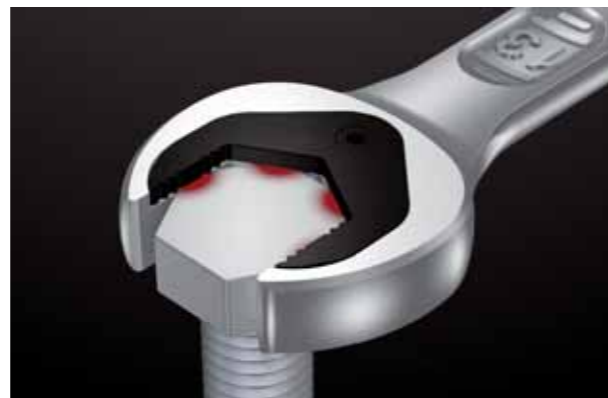
Zmniejszenie ryzyka ześlizgnięcia się klucza poprawia wydajność pracy.