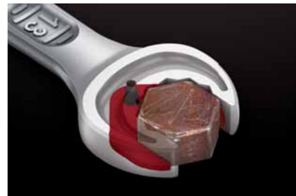
Mindre risk för avglidning och färre skador.