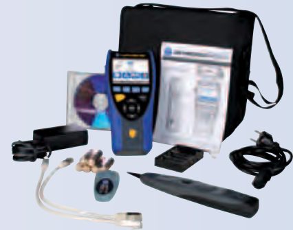
LanXPLOER PRO – Premium kit

Zusätzlicher Lieferumfang beim Premium-Paket