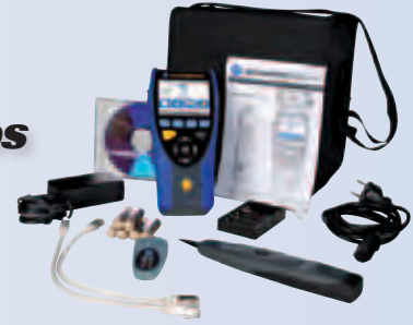
LanXPLOER PRO - Premium kit

LanXPLOER está disponible en tres modelos distintos, cuyas especificaciones se adaptan a las necesidades de todos los usuarios