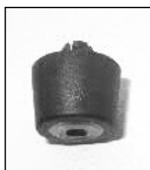
Abbildung / Figure 3

For use together with an IR 550 A system, please press the included round feet (3) into the drill holes on the bottom side of the adjustment angle.