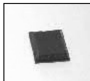
Abbildung / Figure 2

Für die Verwendung mit einem IR 550 A System, stecken Sie die beiliegenden, runden Gummifüße (3) in die Bohrungen auf der Unterseite der Stellwinkel.