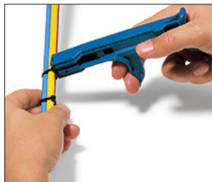
Werkzeug ansetzen, Kabelbinder spannen.