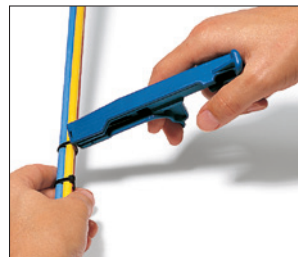
Abschneiden durch Drehen des Werkzeuges.