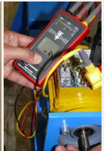
Kontrollera motorrotation före anslutning