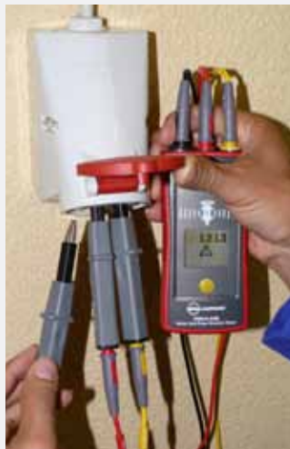
Kontrollera uttagets kabeldragning