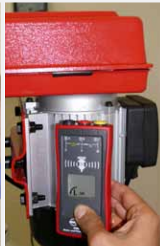
Kabellös avkänning av motorrotation