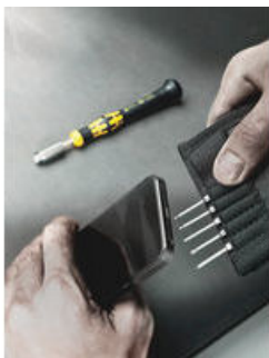
In praktischer Falttasche