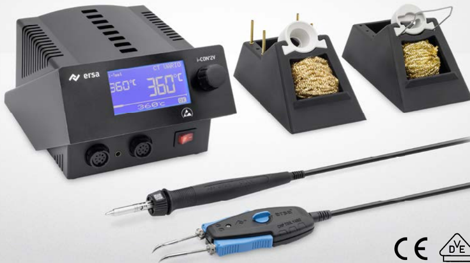
i-CON 2V MK2 mit i-TOOL MK2 & CHIP TOOL VARIO