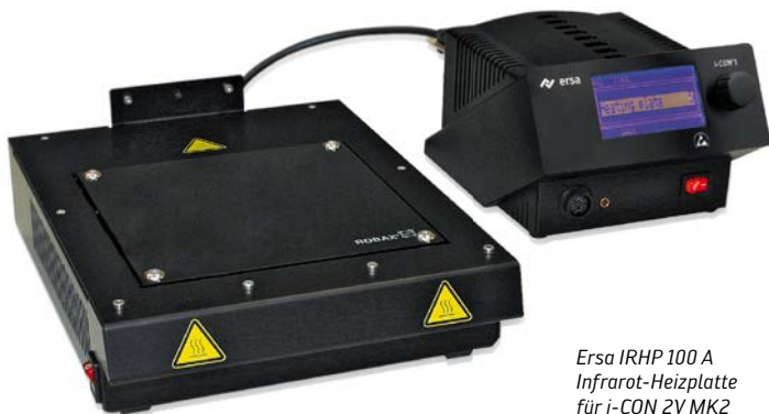
Ersa IRHP 100 A Infrarot-Heizplatte für i-CON 2V MK2 oder i-CON 1V MK2 mit Schnittstelle.