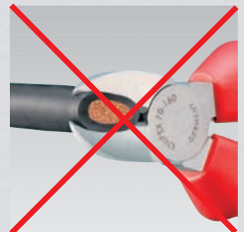
Kabelschnitt mit Seitenschneider: hoher Kraftaufwand, unsauberer Schnitt, starkes Verformen und Quetschen des Kabels